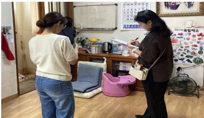
<현장 실사 모습>

센터는 지난 7월 우리다문화장학재단이 주관하는 '공부방 환경개선사업' 공모에 참여해 고창 관내 다문화·취약계층 자녀 15명을 신청했다. 서류심사와 현장실사를 거쳐 지난 9월 최종적으로 12가정이 선정됐으며, 이는 전국 최다 선정 가정 수로 의미가 크다. 당초 책상과 책장 지원에 그칠 예정이었으나, 심의를 거쳐 5가정은 도배·장판 등 리모델링까지 진행하기로 했다. 센터는 앞으로도 지역 내 소외된 가정의 아이들에게 실질적인 도움이 될 수 있는 다양한 지원사업을 지속적으로 확대할 계획이다.